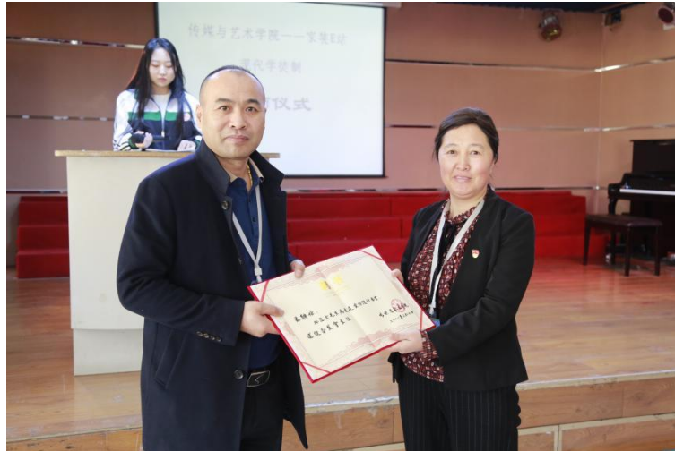
图 6 建筑室内设计专业拜师仪式领导合影

2019 级建筑室内 专业提出申 的 40 名学生 家 站开展了企业实 活动，分别 入了市场 ， ，施工 等相关工作岗位开展了 岗实 。