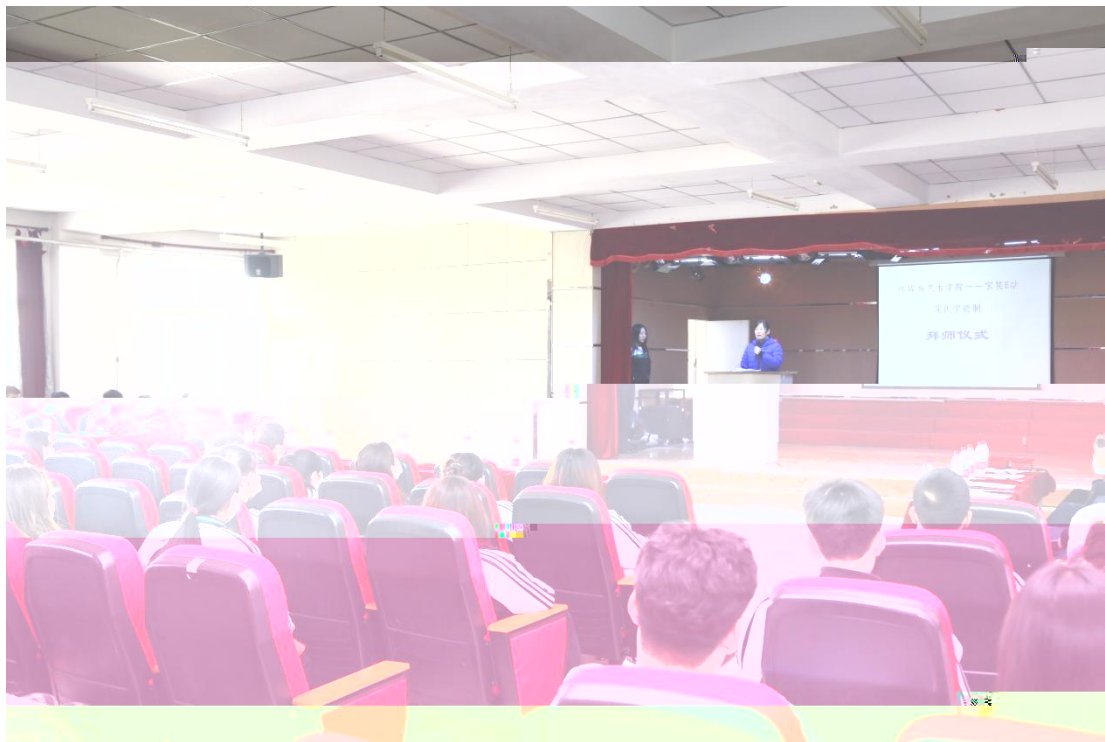
图 8 建筑室内设计专业拜师仪式领导讲话

波对上一段“现代学徒制”作了实的总 并深刻剖析现代学徒制学习方式，同时对 19 级学生的 程 制、学生管理、疫情 控等方 作了具体的安排。孙 和企业师傅代 对学生在企业工作、学习、生活、 定及企业文化等方 。 处 从校企合作教 教学为切入点，对“现代学徒制”的教学管理提出了新的 求。