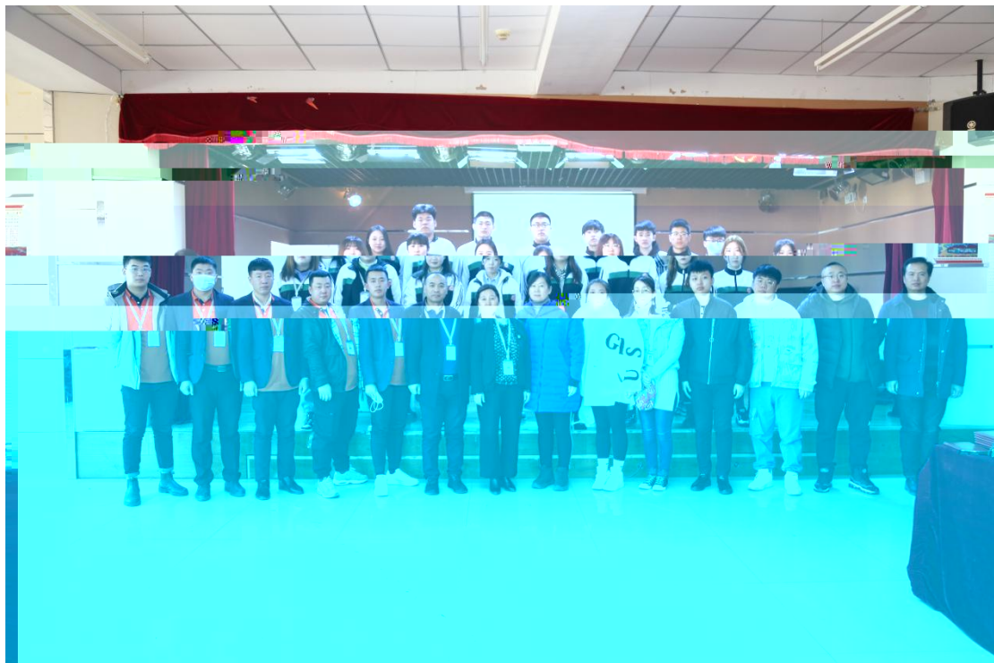
图 7 建筑室内设计专业拜师仪式师生合影

2019 级建筑室内 专业提出申 的 40 名学生 家 站开展了企业实 活动，分别 入了市场 ， ，施工 等相关工作岗位开展了 岗实 。