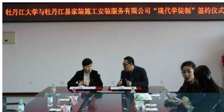
图 1 牡丹江大学与企业签约仪式

（一）校企共研招生招工模式。双方 各 站发布招生招工一体化及 点班班 信息，在新生入校后组织宣 、 核方式成立 点班，明确 点班学员双 份，建立末位淘汰机制；签 “校企生”三方协 ， 一步明确三方权 。