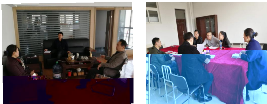
图 2 与企业商讨人才培养目标

(一) 共同 专业人才培养方案。根据学徒岗位 求，校企 合 学生在学校和企业的学习内容、教学安排、教学形式和教学方法等环 ， 点工作实 ，不断优化教学安排和教学手段。