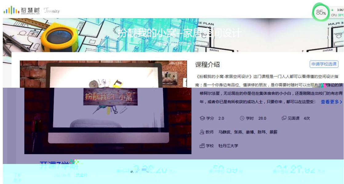
图 5 扮靓我的小窝在线课程

2018-2019 年校企师傅共建《扮 我的小窝》在线 程， 程 2019 年为省级精品在线开放 程，并在智慧树平台上线，学生对有丰富实 的 企业师傅参与授 的在线 程 常欢 ，授 程学生既 听到学校 师 幽 的理 知 传授，也 得到企业师傅扎扎实 技 的指导。